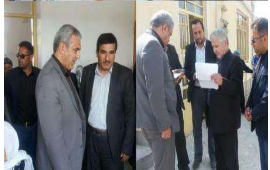
ویزیت رایگان پزشکان فوق تخصص و متخصص اعزامی در مناطق محروم