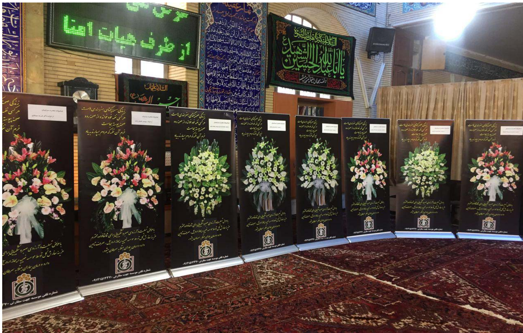
نمونه استند های تسلیت موسسه خیریه ریحانه اردبیل